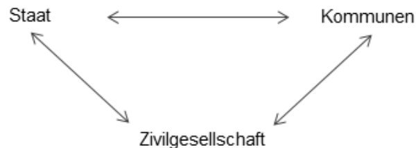
Abb. 2: Dreiecksbeziehung der beteiligten Akteure

In der Beobachtung und Beurteilung der letzten Monate ist dieses Bild dem einer Dreiecksbeziehung zwischen drei beteiligten Akteuren gewichen (Zivilgesellschaftliche Akteure – staatliche Behörden – Kommunen) (Abb. 2).